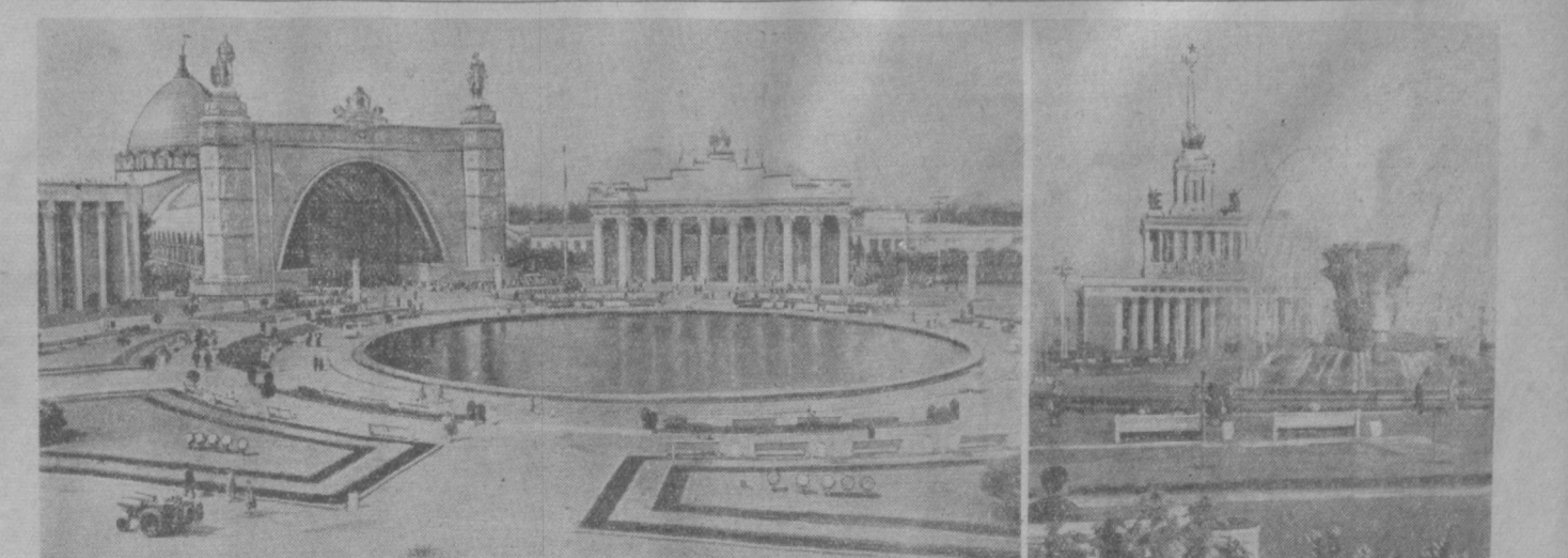
Москва. Всесоюзная сельскохозяйственная выставка 1956 года. На снимках: 1. На площади механизации. 2. Вид на фонтан «Дружба народов» и Главный павильон.