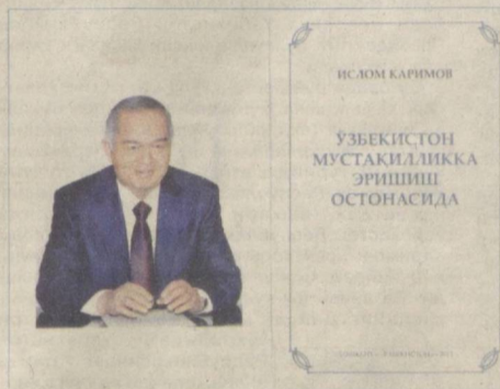
ИСЛАМ КАРИМОВ ЎЗБЕКИСТОН МУСТАҚИЛЛИККА ЭРИШИШ ОСТАНАСИДА

Президент Ислам Каримовнинг «Ўзбекистон мустақилликка эришиш остонасида» китоби юзасидан давра сўхбати