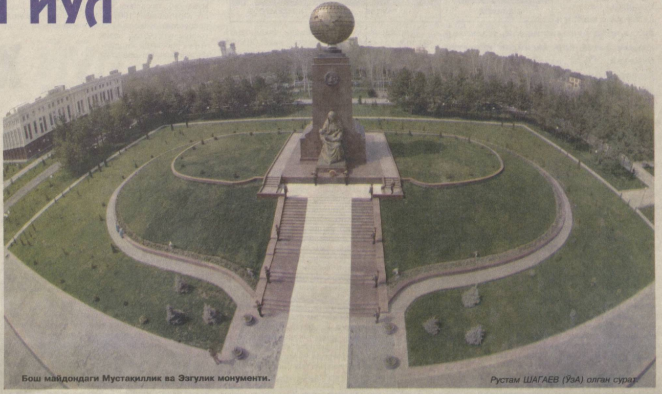
Бош майдондаги Мустақиллик ва Эзгулик монументи.