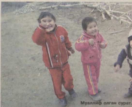
Муаллиф олган сурат.

Халқимиз даҳоси яратган ёки ўзга халқлар тилида гавхардай ярқираб турган оғзаки ижоднинг мақол жанри бевосита миллат маънавиятига хизмат қиладди.