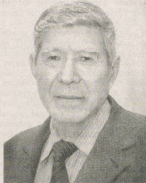
«Оламда нима ган» бўлган чоғ Мўминовага тақлид қилардик.

Қалдирғочдек тизилиб олиб, Мултфилмлар кўриб тинардик.