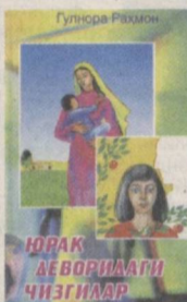
Юрак деворидаги чизгилар

Шеърлардан таркиб топган салмоқлигина тўплам ижодкорнинг кейинги йиллардаги ижодий изланишлари самарасидир. "Марварид шодаси" номли қисса билан бошланиб ўзига хос тоза туйғули шеърлар билан хонтамопадан ушбу китоб мундарижасидан ўқувчи "Юрак деворидаги чизгилар" номли асарини излаб тополмайди. Аммо ижодкор сийратининг меҳвари бўлган юракнинг тарихиди, расмон, шоир, адиб кўнглидаги кечмишлар айнан шу тарзда ифодаланишига ишонади.