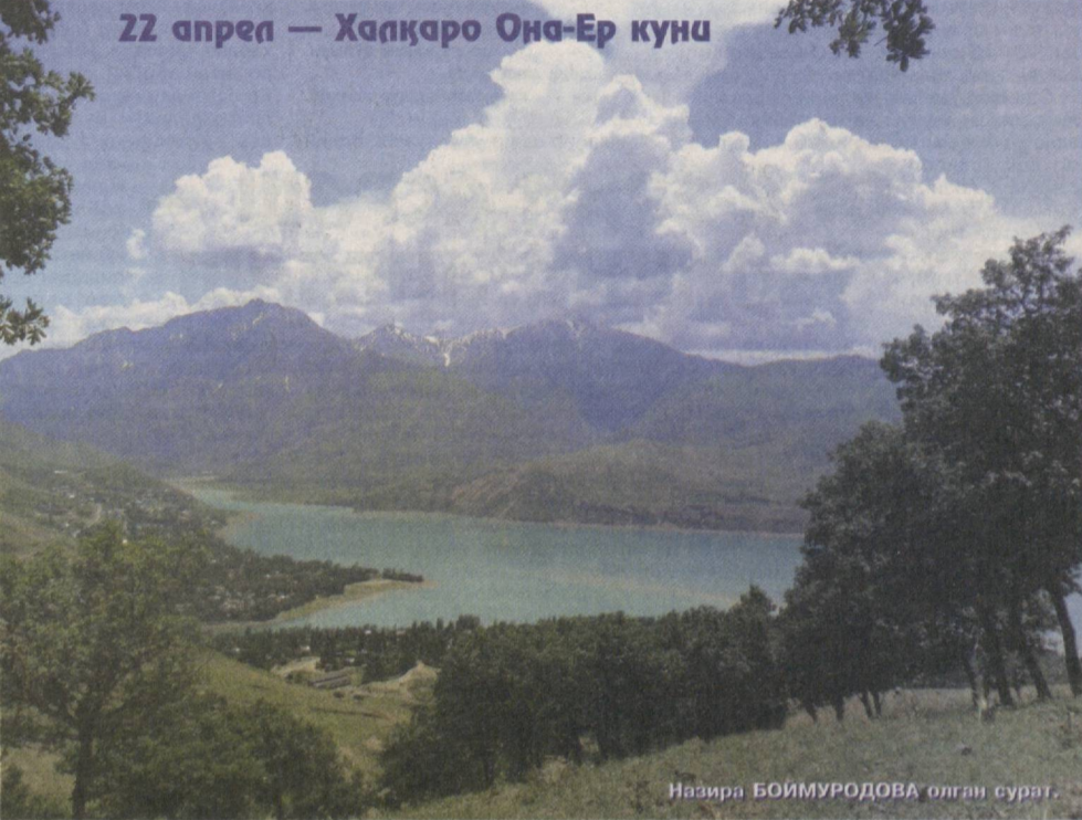
22 апрел — Халқаро Она-Ер кун