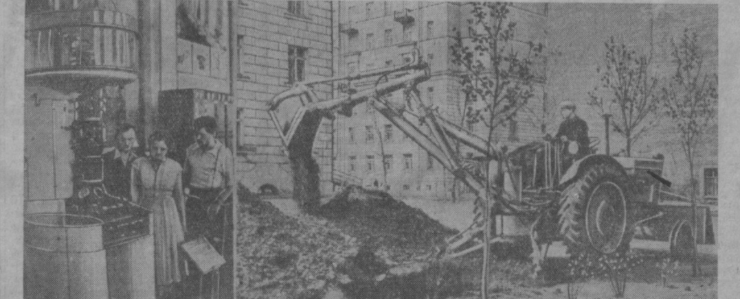
1. Всесоюзная промышленная выставка 1956 года. Посетители в разделе оптики лавильона «Машиностроение» осматривают универсальный электронный микроскоп, позволяющий получить увеличение в 600—40.000 раз. 2. При работе на дровяных и других небольших территориях успешно применяются землеройные машины «Э-153», выпущенные Клепкинским заводом «Красный экскаватор». На базе колесного трактора «Беларусь» смонтированы стрела с ковшом емкостью в 0,15 кубического метра и грейдер. Все рабочие рычаги и опоры для закрепления машины приводятся в действие с помощью гидравлических насосов. Новой машиной можно рыть траншеи и производить их засыпку, укладывать трубы, использовать механизмы как бульдозер и кран. На снимке: экскаваторщик комсомолец Ф. Кравченко роет траншею в одном из дворов Ленинграда. (Фотохроника ТАСС).

Новый экскаватор отправляется на одну из крупнейших строек шестой пятилетки — Соколовско-Сарбайский горнообогатительный комбинат в Казахстане для разработки железорудных месторождений. Он заменит труд нескольких тысяч горняков. Для отправки агрегата потребуется около 100 железнодорожных вагонов.