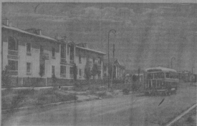
По городам Узбекистана. На снимке: улица имени Пушкина в Ангрене.

Все-то за рубежом заинтересован в том, чтобы иметь в СССР искусственно созданные коммунистические партии, финансируемые иностранным капиталом и служащие его интересам. Но советские люди не нужны такие партии; советские люди никому не навязывают своих общественных порядков, но и чужих порядков принимать не намерены.