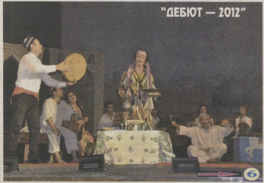
«Майсаранинг иши» спектаклидан кўриниш. Режиссёр Аброр Ортиқов.

Ислом КАРИМОВ, Ўзбекистон Республикаси Президенти