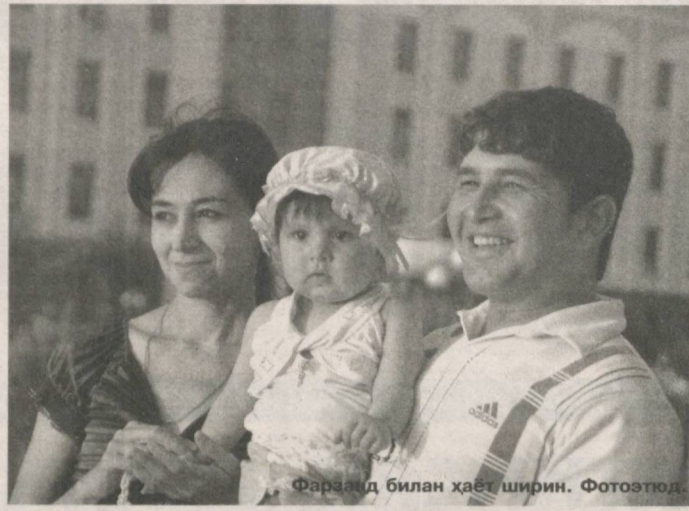
Фарзанд билан ҳаёт ширин. Фотоэпд.

Тоғанинг неваралари «амаки», фарзандлари «ака, ука» деб атайдиган Мусон ақанинг бу оилага тамоман бегона эканлигини мутлақ сезма-