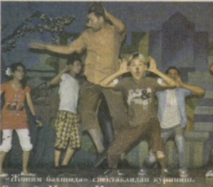
«Жонинг бахшида» спектаклидан қўриниш. Режиссёр Муқаддас Мамадалиева.