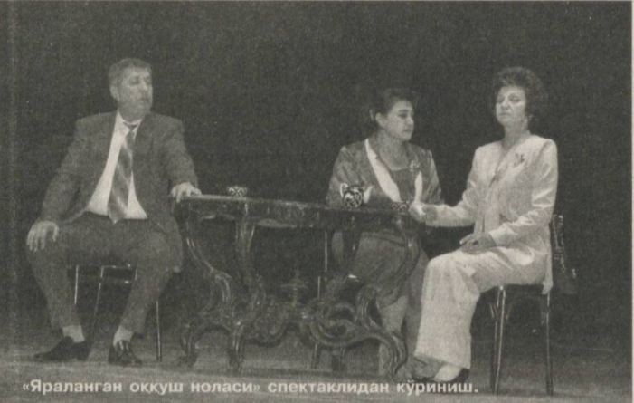
"Яраланган оккуш ноласи" спектаклидан кўриниш.

залишига умид бўлмагани учун уйга жавоб беришади. Бу орада рассомнинг ўзини даволоччи шифокорга аллақандай ҳазина ҳақида гапиргани фарзандларига маълум бўлади. Барча зиддиятлар, қелинчиликлар ана шундан сўнг бошланади.