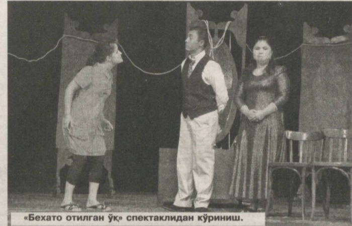
«Бехато отилган ўқ» спектаклидан кўриниш.

Эътиборли жиҳати шундаки, етук педагог кадрларнинг ёш ижодкорларни тарбиялашдаги ўрни нақадар беқиёс экани кўрик мисолида яна бир бор тасдиғини топди. Ёш дебютантларга маҳорат сирларини ўргатган