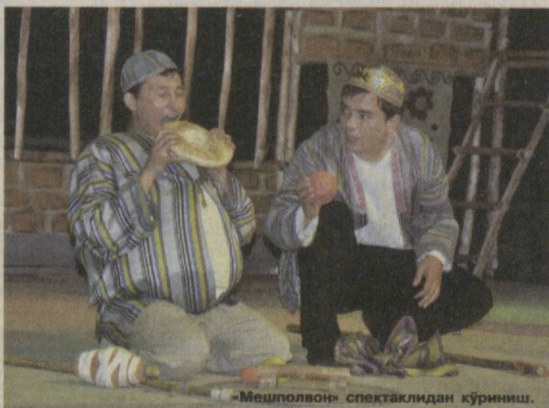
«Мешполвон» спектаклидан кўриниш.

Бу йилги фестивал давомида турли жанрлардаги, кенг қамровли мавзуларни кўтариб чиққан, хилма-хил гоғларни акс эттирган спектакллар томошабинлар ҳукмига ҳавола қилинди. Уларнинг аксарияти томошабинлар ва соҳа мутахассислари томонидан яхши кутиб олинди.