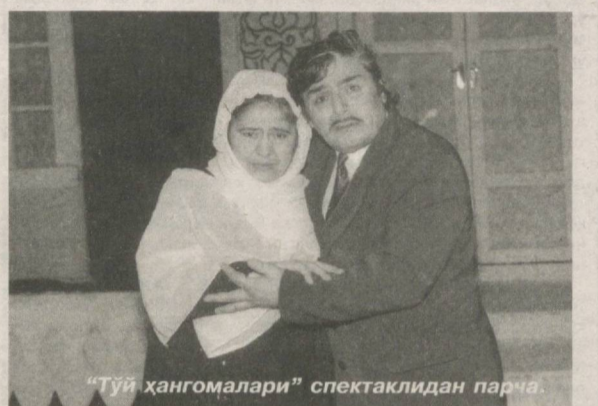
"Тўй хангомалари" спектаклидан парча.