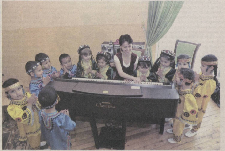
Бирга, бирга қўйлаймиз диёримизни.