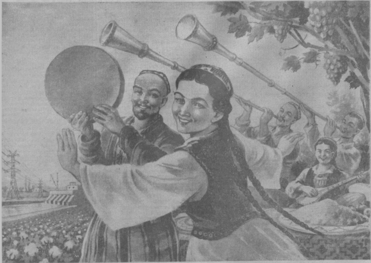
Рис. С. Марфина.