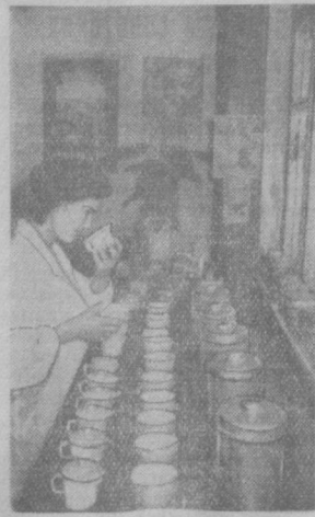
Коллектив Самаркандской чайразвесочной фабрики приступил к переработке чайного листа нового урожая, полученного из Гвужая.