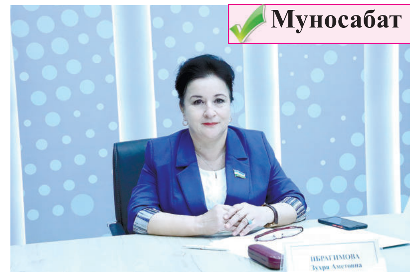
Зухра ИБРАГИМОВА, Олий Мажлис Қонунчилик палатаси Спикери ўринбосари, «Адолат» СДП фракция раҳбари