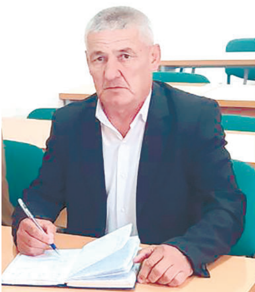
Аваллари китоб доимий ҳамроҳи, газета ҳаётимизнинг бир бўлаги эди. Илм-фан, техника, сиёсат, маданият, маънавият, адабиёт ва санъатдаги барча янгиликлардан хабардор бўлиб турардик. Бир-биримиз билан баҳслашардик. Газета сотиб олиш учун дўконлар олдида навбатда турардик. Даста-даста матбуот нашрлари хонадонимизга етиб келарди. Дунёқарашимиз кенг, сўзамол эдик. Оламдаги энг сўнгги янгиликлар кўз ўнгимизда намойён бўларди. Газетадан хироқлашганимиз сари руҳан сўниб бордик. Бахслар йўқ. Ҳамсуҳбат топилмайди. Одамлар камгап. Телефондаги олди-қочди мавзулар ва маънавий хабарлар гирдобига ўралашиб қолдик.

Бугун марра олдинга интиланганики. Ростини айтганда, бир мудат ҳамма нарсани телефон ҳал қиладигандек унга боғланиб қолдик. Лекин вақтни беҳуда сарфлаётганимиз сезилиб қолди.