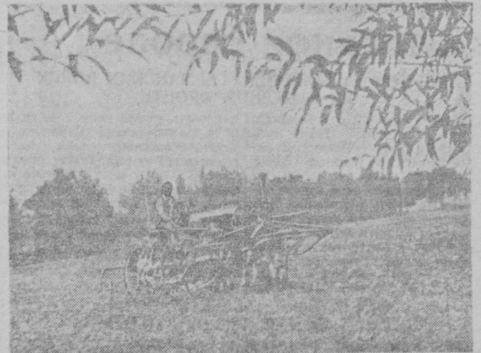
Тракторная культивация хлопца в колхозе им. Куйбышева, Янгй-Юльского района, Ташкентской области.