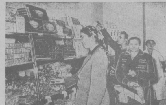
На одной из центральных улиц Ташкента — улице имени Ленина начал работать магазин «Гастроном» без продпацов. Это один из крупнейших магазинов нового типа. В нем большой выбор кондитерских, колбасных, бакалейных и других товаров. В первые же дни товарооборот увеличился почти на 40 процентов. На снимке: покупательница в новом магазине «Гастроном».

Принимается лица без ограничения возраста, имеющие законченное среднее образование, работающие на производстве, в учреждениях и организациях.