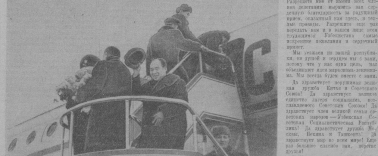
На снимке: проводы делегации Всекитайского собрания народных представителей в Ташкентском аэропорту.