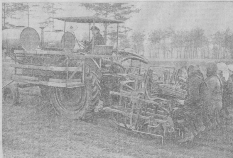
На снимке: новая машина «СРН-4» за работой.

Рассадопосадочная машина навешивается на трактор «Беларусь», который движется вдоль мерной проволоки, наткнутой в поле. Уалы мерной проволоки, расположенные на расстоянии 60—70 сантиметров, приводят в движение посадочный аппарат машины, на лопастях которого прикреплены металлические корзинки. Четыре работницы, сидящие на машине, закладывают в эти корзинки торфопитательные горшочки с рассадой. Вал поворачивается, и корзинки с рассадой опускаются в почву, которые проваливаются в землю четыре параллельные борозды глубиной в 10 сантиметров. Специальный рычаг открывает дно корзинки, и четыре горшочка одновременно плавно опускаются в бороз-