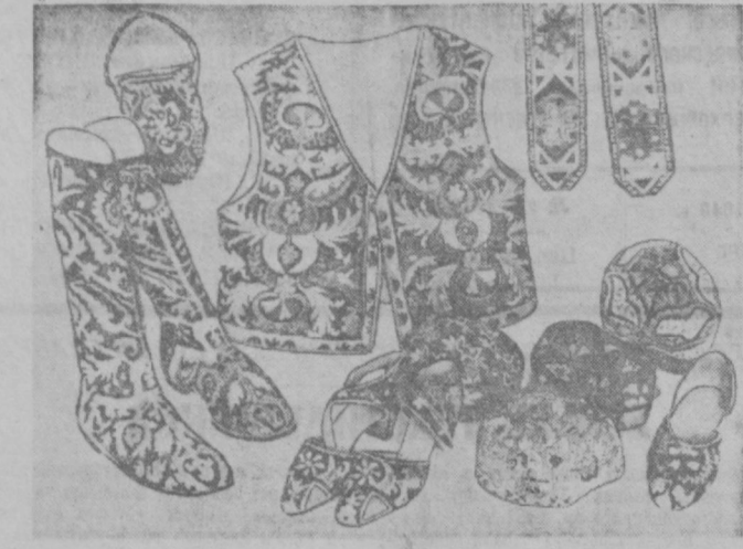
Расширяется ассортимент изделий, выпускаемых шахрисабзской вышивальной артелью «Худжум» и китаской им. 8 Марта. На снимке: образцы новых изделий.