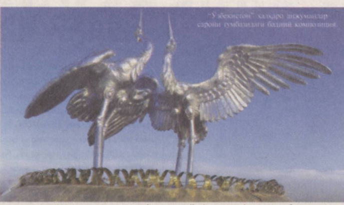
“Узбекистон” ҳалқаро элчулар саройи тумбализми беднин композицияси

мамлакатимиздаги истиқлол шукҳини ҳис этгандек бўласиз. Аввало асарларнинг мавзуси эътиборингизни жалб этади. Кўргазмадан ўрин олган ижод намуналари шунчаки шаҳар ҳаётига бағишланган маънавий мавзудаги тасвирлардан иборат эмас. Асарларнинг барчаси мустақиллик йилларида амалга оширилган кенг қўламли бунёдкорлик ишларига бағишланган бўлиб, пойтахтимиз чиройига чирой кўшиб турган меъморий обидалар ҳақида сўзлай-