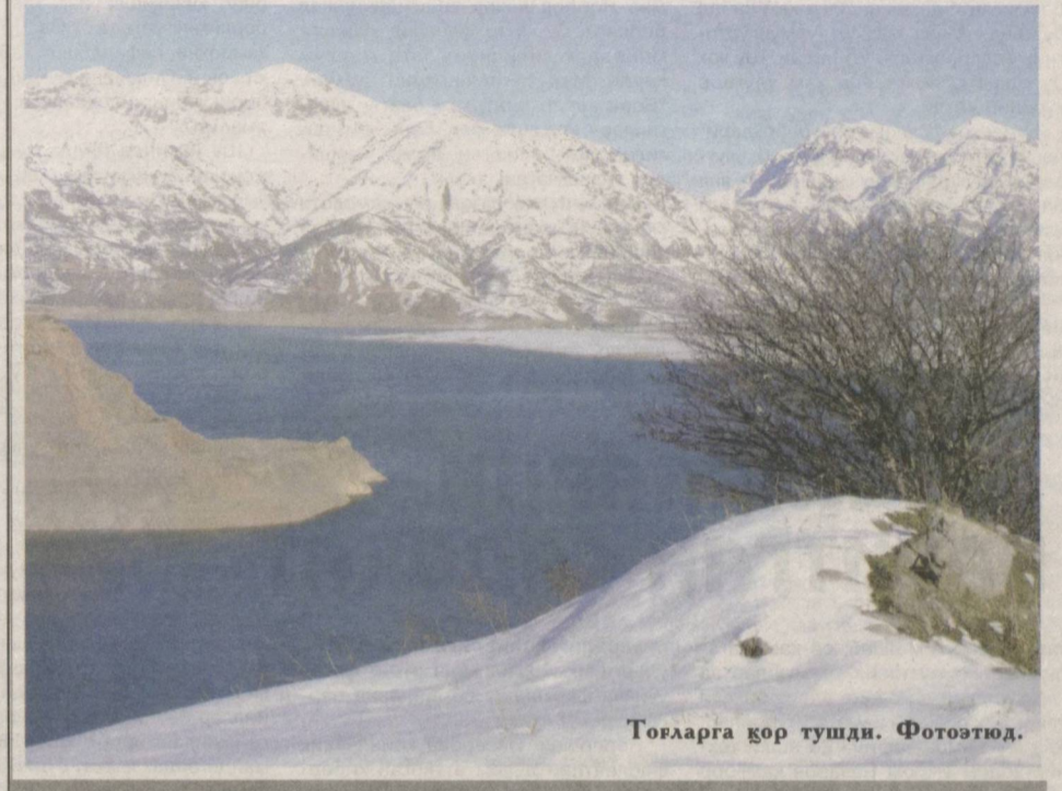
Тоғларга қор тушди.

Зеро, юртини севган, уни обод қилишга ўзини бурчдор ҳисоблаган, ҳаёти тинч, оиласи мустаҳкам, қалби шукронага бисёр одамларнинг ҳамиша қадами қўлғудир.