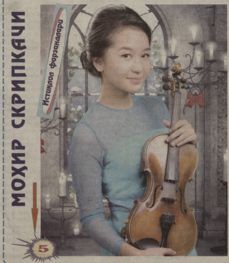
Давоми иккинчи саҳифада.