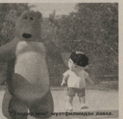
"Тандир нон" мултфилмидан лавҳа.

учун илк тажрибалардан бири бўлган ушбу мултфилм "Тандир нон" асаридан анча муваффақиятли чиққан, дейиш мумкин.