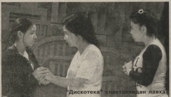
"Дискотека" спектаклидан лавҳа.

шадди, деб ўйлайди. Дискотекада тенгқурларига қарата алам билан айтган куйидаги сўзлари ҳам бунга тасдиқлайди: "Мен қаерда ўқишимни, қандай қизга ўйланиб, қачон қайси "кресло"га ўтиришимни ҳам яхши билмаман. Шунинг учун менга ҳасад қиласанлар. Ҳа, ҳаммаси дадам тўфайли. Дадам қилиб беради ҳаммасини! Нима бўпти? Менда бор ўшанақа дада, сенларда эса йўқ!"