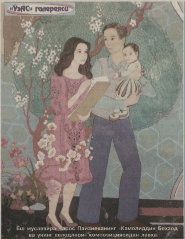
Ёш мусаввир Чарос Пайзиевнинг «Камолитдин Бехзод ва унинг авлодлари» композициясидан лавҳа.