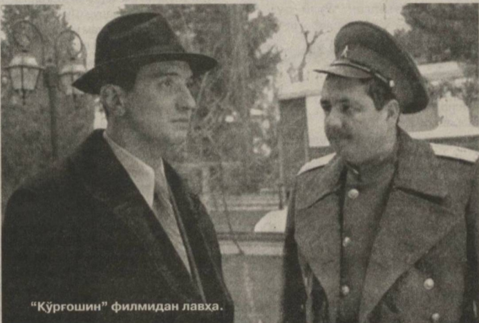
"Кўрғошин" филмидан лавҳа.

Эътиборли жиҳати, муштақлик йиллари суратга олинаётган филмларда сюжетнинг турфа шакллари, мазмун ва ифоданинг янгича услублари пайдо бўлмоқдаки, бу албатта миллий кино санъатимизнинг миёёси ва қамрови кенгайиб бораётганидан далолатдир. Бугунги киножараёнда кўплаб катта-кичик режиссёрлар сюжетга анъанавий ёндашувдан чекланиб, соф реалистик, фалсафий-рамзий, экцентрик, фантастик, руҳий-психологик жанрдаги филмларни суратга олишга интилаётгани муҳим ҳодиса.