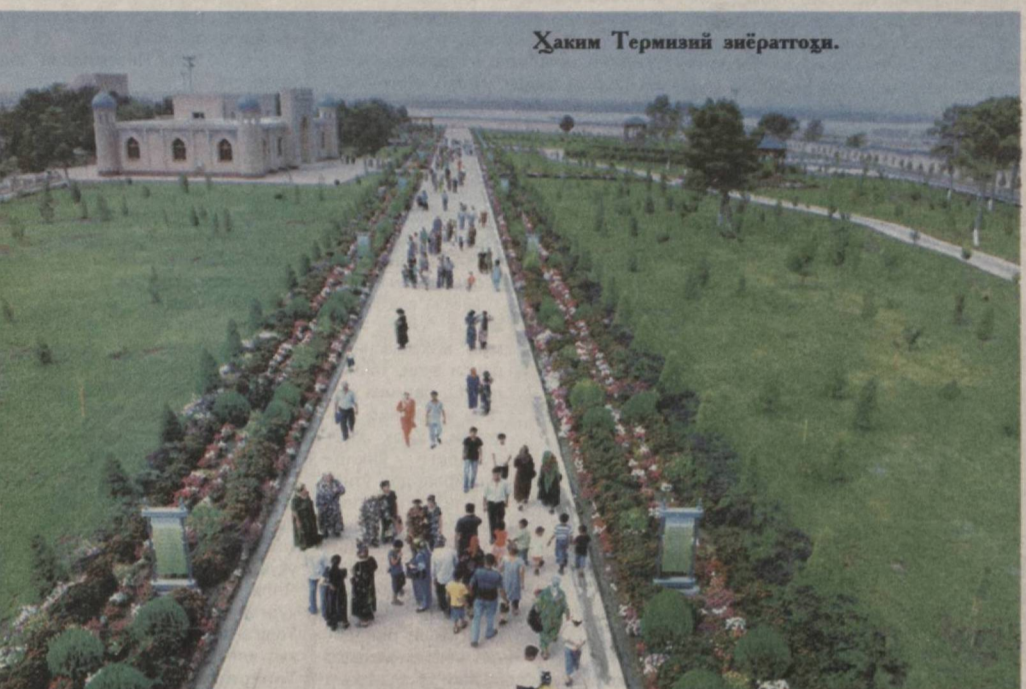
Ҳаким Термизий зиёратгоҳи.

Мустақиллик байрами арафасида яқин ўтмишга назар ташлаб, ўз халқи ва Ватанимизнинг озодлиги йўлида фаолият кўрсатган, асарларида эрк ва ҳуррият тароналарини куйлаган аждодларимизнинг муборак номларини ёд этиш, улар хотирасини эъзозлаш эзгу аъёнлардан бири бўлиб қолди.