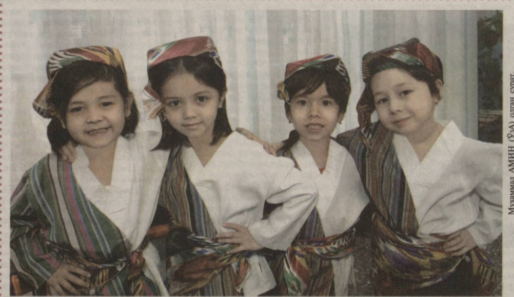
Маъна қилиб рақсага тушдик...

Газета-журналларда бо- силган эртактлари билан ўқувчилар эътиборини қозонган адабининг 2012 йили "Шарқ" нашриёт-мат- баа акциядорлик компания- си бош таҳририяти томо- нидан чоп этилган "Қизил олма" эртактлар тўплами унинг қалами сайқал топа- ётганини намён этган, десак муболага бўлмайди. Айтайлик, "Қизил олма" эртагида олижаноб йигит Али билан ишбўқмас, дан- гаса Валининг бошидан кеңирганлари қизиқарли хикоя қилинади. Бир кун улар аравада дала йўлида кетаётиб, қоп орқалаган қарияни учратиб қолиша- ди. Али чолни аравада эл- тиб қўйишни таклиф эта- ди. Вали вақтимизни кет- казмай тезроқ уйга бориб дам олайлик, деб инжиқ- лик қилади. Али барибир