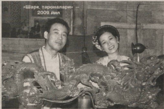
"Шарқ тароналари" — 2009 йил

зим. Баъзи замонавий олимлар Европа ва Шарқ муסיқа аъёнларининг бирлашишида (синтезида) жаҳон муסיқа маданиятининг истиқболли тараққиёт йўлини кўрмоқда. Анжуман иштирокчилари ушбу мураккаб масалада ўз сўзларини айтишлари лозим бўлади.