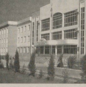
Термиз туризм ва меҳмонхона хўжалиги касб-хунар коллежи.

этилганидан ҳайрат бармоғингизни тишлайсиз. Кошинли йўлакларнинг икки гирдида барқ уриб ўсган майсалар, ранг-баранг гуллар, антиқа манзарали дарахтлар. Ҳар сақиз-ўн метр масофада ўриндиқлар қўйилган, Ат-Термизий бонбонинг ҳикматли сўзлари ёзилган лавҳалар ўрнатилган.