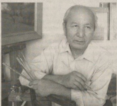
Рустам ХУДОЙБЕРГАНОВ, Ўзбекистон халқ рассоми

Тасвирий санъатда ҳам барча бадний ижод турларидаги каби ўз йўлини топиш учун биргина иштиёқ камлик қилади. Барчаси табиат берган истеъдодга боғлиқ, деб ўйлаганлар ҳам адашди. Аслида, рассомнинг ўз услубини, ижоддаги "мени"ни топиши катта изланишлар талаб этувчи машаққатли жараён.