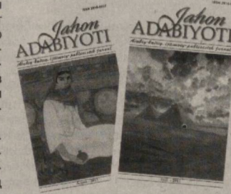
«Жаҳон адабиёти» журналы адабий-эстетик ва фалсафа тарихидан муҳим ва муҳим ўрин олган машҳур асарлар таржимасига ҳам изчил эътибор қаратиб келаятир. Хусусан, журналда босилган машҳур рус адабиётшуноси ва файласуфи Михаил Бахтиннинг «Романда замон ва хронотоп шакллари» (У.Журақулов таржимаси) номли фундаментал тадқиқоти, Лев Гумилёвнинг «Этнослар ва та-

Қорақалпоғистонлик адабиётшунос олим Қ.Ўразимбетов ва таниқли шоира Г.Матқубованинг сўхбати, С.Абросимовнинг «Хива рўёси» сафарномаси (О.Мутал таржимаси), С.Ёқубовнинг «Араб баҳори»ми ёки араб лабиринти» мақоласи, шунингдек, жаҳон маданияти ва санъат даргалари ҳаёти ҳамда фаолиятига доир қизиқарли маълумотлар, лавҳалар ҳам журналнинг ушбу сонлари мундариҳасини бойитишга хизмат қилган.