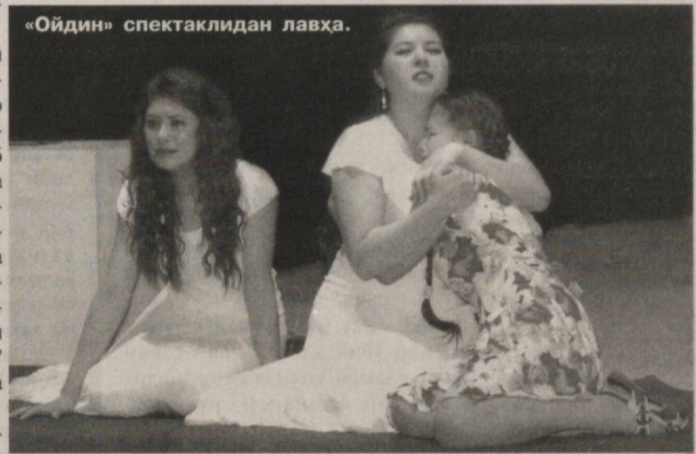
«Ойдин» спектаклидан лавҳа.

Маълумки, театр спектакли турли санъатларнинг ўзаро бирикуви натижасида юзага келади. Яъни актёр, драматург, rassom, бас-такор ва бошқа ёрдამчи гуруҳларнинг ижодий изланишлари режиссёр раҳбарлигида аниқ белгиланган гоёвий мақсад асосида ўзаро уйғунлашган тақдирдагина яхши спектакл дунёга келади. Шу нуктаи назардан, Сирдарё вилоят театри саҳналаштирган «Аёл қадри» спектакли нафақат ушбу кўриктанловда, балки замонавий ўзбек театри амалиётида ибратли воқеа бўлди, деб айтиш мумкин. Спектакл, аввало, самимиети, персонажлар хатти-ҳаракатларининг ҳаётлиги, табиийлиги билан диққатни жалб этади. Томошанинг бадий ечимида барча таркибий қисмлар пухта ўйлашиб, режиссура ат-