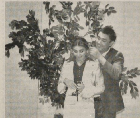
«Аёл қадри» спектаклидан кўриниш.

Албатта, ҳар қандай спектаклда маълум камчиликлар бўлиши табиий. Сирдарё теат-