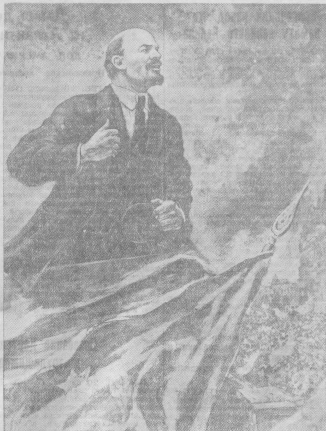
В. И. Ленин на трибуне. С картины художника А. Герасимова.

Волнующие мысли и чувства рождают у посетителей всякая вещь, которой когда-то пользовался Ильич, — всякая строка рукописи, написанная его рукой, статья, книга — все, что связано с его великим именем. Документ музея отображает единство взглядов, боевое и идейное содружество