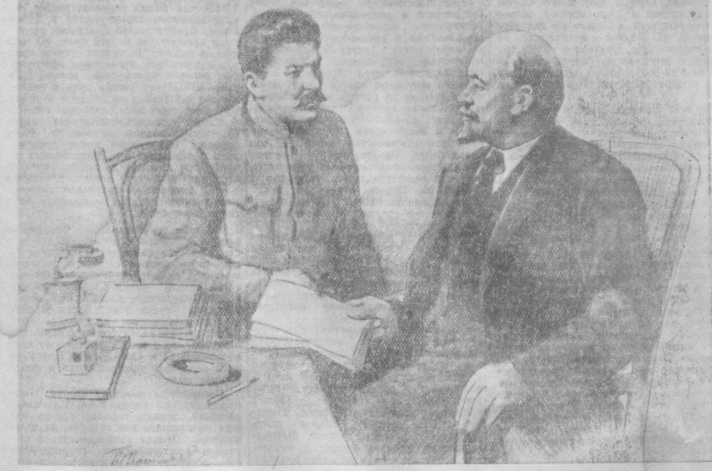
В. И. Ленин и И. В. Сталин. Рисунок художника П. Васильева.

Послевоенное развитие Советского Союза с новой силой подтверждает неоспоримые преимущества социалистической системы хозяйства перед капиталистической.