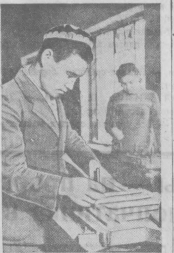
На снимке: формирование Ташкентского коммунистического завода Министерства металлургии СССР.

По страницам газеты «За прочный мир, за народную демократию»