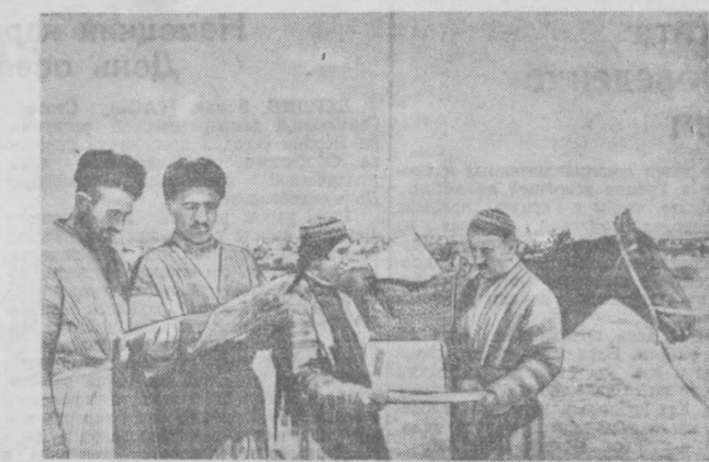
Члены колхоза «III Интернационал», Бешенетского района. Кашка-Дарьинской области, ежедневно получают на пастбище газеты и журналы. На снимке: поташовка привез газеты.

Н. УВАРОВ (Корр. «Правды Востока»), г. Ангрэн.