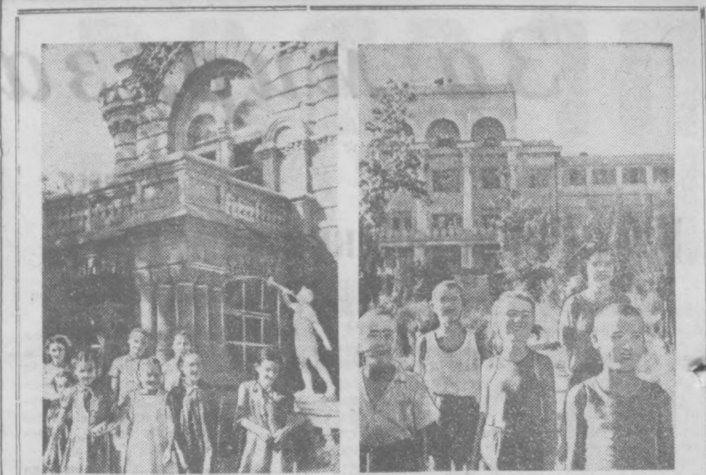
5. СОВЕТСКИЙ НАРОД, ТОВАРИЩ СТАЛИН делают все для того, чтобы росли ребята здоровыми и сильными, хорошо учились, хорошо отдыхали. Каждый год в дни летних каникул в распоряжение школьников предоставляются детские санатории, пионерские лагеря, специально оборудованные детские площадки. Среди внешкольных детских учреждений столицы Узбекистана выделяются Дворец пионеров имени Сталина (снимок слева). Здесь широко развита художественная самодеятельность. Сотни школьников активно участвуют в работе многочисленных кружков. На снимке справа — детский санаторий имени Кагановича в селе Луначарском. Здесь ребята весело отдыхают, набирают силы.

ПРАГА. 30 мая. (ТАСС.) Большим событием в музыкальной жизни Праги являются концерты выдающихся советских пианистов Эмил Гилельсы и Святослава Рихтера. Пражская печать дает высокую оценку их мастерству. Вчера в Доме работников искусств состоялся очередной концерт Святослава Рихтера. Советский пианист исполнил пьесы из фортепианного цикла «Времена года» Чайковского, ряд этюдов Рахманинова, а также «Картины с выставки» Мусоргского. Концерт прошел с большим успехом. Концерты советских пианистов проходят под лозунгом: «Советская музыка указывает путь к миру и строительству».