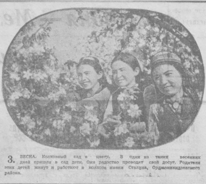
3. ВЕСНА. Колхозный сад в цвету. В один из таких весенних дней пришли в сад дети. Они радостно проводят свой досуг. Родители этих детей живут и работают в колхозе имени Сталина, Орджоникидзевского района.