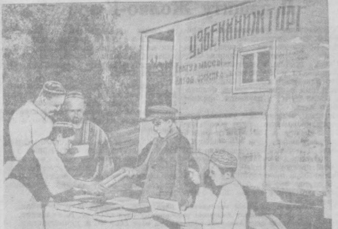
Бухарская областная контора «Узбекинторг», идя навстречу пожеланиям колхозников, оборудовала походный магазин, который уже побывал в самых отдаленных колхозах области. За два месяца торговли на подок реализовано книг на 162 тысячи рублей. Сельскохозяйственная артель имени Акулибаева, Денауского сельсовета, Шафринского района, купила книжных новин на 12.600 рублей. На 6—8 тысяч приобрели литературы хлопководы колхоза «Ленинград», Гиджуванского района, имени Калинина, Пешунского района, и много других. На снимке: продажа книг в колхозе имени Сталина, Гиджуванского района.