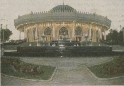
Давоми иккинчи саҳифада.

Уша тарихий воқеадан уч йил ўтиб, Амир Темур номидаги хибонга туташ майдонда яна бир улкан қурилиш бошланди. Президентимиз Ислам Каримов 1996 йилнинг 14 март куни Тошкент шаҳрида Темурийлар тарихи давлат музейини бунёд этиш ҳақидаги фармонга имзо чекди. Буюк Соҳибқирон ҳазратларининг қутлуг тўйига атиги бир неча ойлар қолган эди. Ана шу қисқа фурсатда минтақамизда ягона бўлган бундай улкан, салобатли кошонани қуриш айтишга осон эди. Аммо Юртбошимиз ташаббуси ва раҳнамолигида улкан қурилишнинг пухта режаси тузилиб, бунёдкорлик