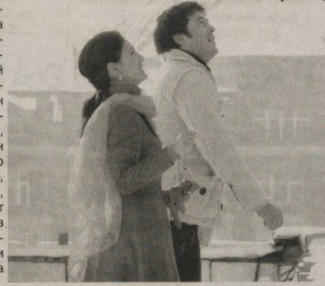
«Телба» филмидан лавҳа.

Сценарий муаллифлари-нинг ноъбанавий мавзу ва гоя танлагани, киносце-нарийга қалбни ўртовчи воқеани асос қилиб олгани, энг муҳими, уларни ҳаётий гавдалантиргани эътирофга сазовор.