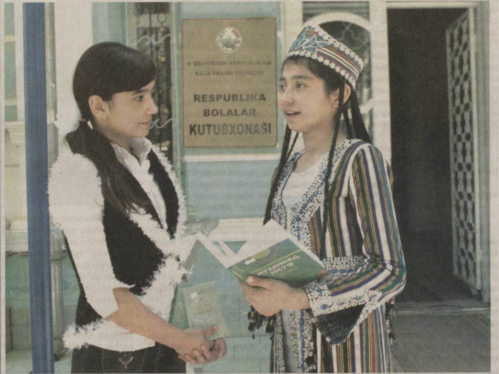
Мутолаа сурури.

21 октябр — "Давлат тили ҳақида"га қонун қабул қилинган кун