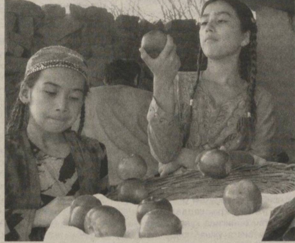
«Паризод» филмидан лавҳа.

ган мотоциклда оппоқ рўмолига чирманиб олган Пари ва Жонибек тоғ йўли бўйлаб кетиб борадиган кадрда актрисанинг юзи кўринмайди. Томошабин кадрда оппоқ рўмоли шамолда хилпиратган кизни кўради. Яъни, унинг титраётган юраги кино тилига рўмол деталлари орқали ноизиқлик билан ўтилган.