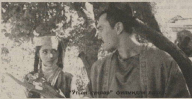
"Ўтган кунлар" филмидан кесак.

завқ-шавқ билан ижро этилган. Шу йилларда шакллана бошлаган Тошкент адабий муҳитида Каримбек Камийнинг ўрни гоаят катта эди. Унинг "Беклар беги" мадрасасидаги фаёзӣб хўжрасида Хислат, Мискин, Сидқий Хондайлийкий сингари шoirлар устоздан сабоқ олиб, бадий ижод пиллапоъларидан секин-аста юксалиб боришган. Мўминҷон Муҳаммадҷонов-(Тошқин)нинг "Турмуш уринишлари" китобида ёзилишича, Хислат XIX асрнинг 90-йилла-рида Каримбек Шарифбек ўгли Ка-миий билан танишган. "Бу одам, — деб ёзган у, — шoir Камий Муқимий ва Фурқат баробаридаги бир шoir эди. Шoir Хислат мавлоно Камийнинг фазлу балоғатини билганидан кейин уни биринчи устоз сифатида уш-лаб олди. Қаерга борса, бирга бор-ди, ширин-ширин ва бамаъни суҳ-батларидан сира ажралгиси келмас ва бир кун суҳбатлардан ажралса, ўзини жонсиз танадек ҳисоблар эди. Гоаятда нозик табииати бу устоз Хи-слатни илхосига яраша тарбия қилар, шейр ва ғазаллар айтиш йўллари-дан баъзи билмаган нуқсонларини ўргатар ва ўша замоннинг адиб ва