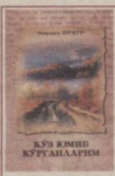
Кўз юмиб кўрганларим

“Кўзи юмгил, кўзга айлансин кўнгил”, дейди Мавлоно Жалолиддин Румий. Дарҳақиқат, кўнгил кўзида намоён бўлган нарсалар чинлиги билан кўзга кўринган нарсалардан кўра ҳақиқатга яқинроқдир. Нечоғли муболага бўлмасин, шоир сўзи унинг кўнгил рози сифатида рост ва гўзалдир.