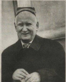
Ҳамон ўзбек мумтоз ашулаларининг юксак намуналаридан ҳисобланади.

Ҳажрабов таъкидлаганидек, мақом ва мақом йўлларидаги асарларни ижро этиш учун ҳофизда катта тажриба бўлиши шарт. Чунки мақомда чуқур нафас, паст пардаларда ҳам, юқори пардаларда ҳам бемаъл айта оладиган бақувват ширани овоздан ташқари, кўникматалаб, мураккаб ижро йўлларидаги асарларни айтиш малакаси талаб этилади. Мақом йўлларида ижод этган бастакорларнинг асарларини мусиқа шинавандаларига манзур қилиб этаклаш ижрочига боғлиқ. Шунинг учун бастакорлар аксарият ҳолларда ашулаларини муайян бир ҳофизга атаб, шу ҳофиз айтсин деб яратдилар. Фаттоҳхон ҳофиз ижросида машҳур бўлиб кетган Тўхтасин Жалиловнинг «Жононим менинг» (Файратий газали), Дони Зокирнинг «Эй сабо» (Навоий газали), Қомилжон Жаҳборнинг «Этмасмидим» (Фузулий газали) каби ашулалари шундай хонишлар сирасидан.