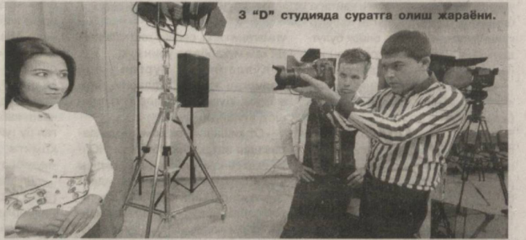
3 "D" студияда суратга олиш жараёни.

танишган ҳар бир ижодкор қалбида «Қани энди мен ҳам ана шу ёшлар ўрнида бўлиб қолсам», деган орзу туғилиши табиий. Биз талаба бўлган даврда нафақат юртимизда, балки