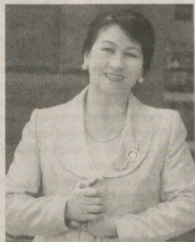
Ҳар бир ижодкорнинг эришган ютуқлари билан бир қаторда орзулари ҳам бўлади. Айниқса, бизнинг авлод ижодкорлари учун шўро тузумидаги мафсуравий қобилқарни ёриб чиқиш осон бўлмаган. Сабаби, миллий