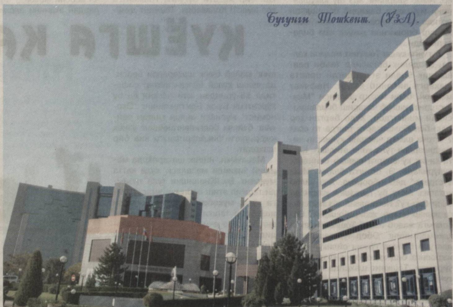
Бугунги Тошкент. (Ў.А.)