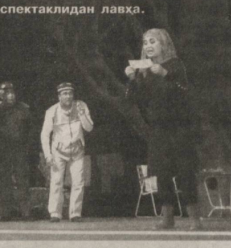
"Ҳазина" спектаклидан лавҳа.