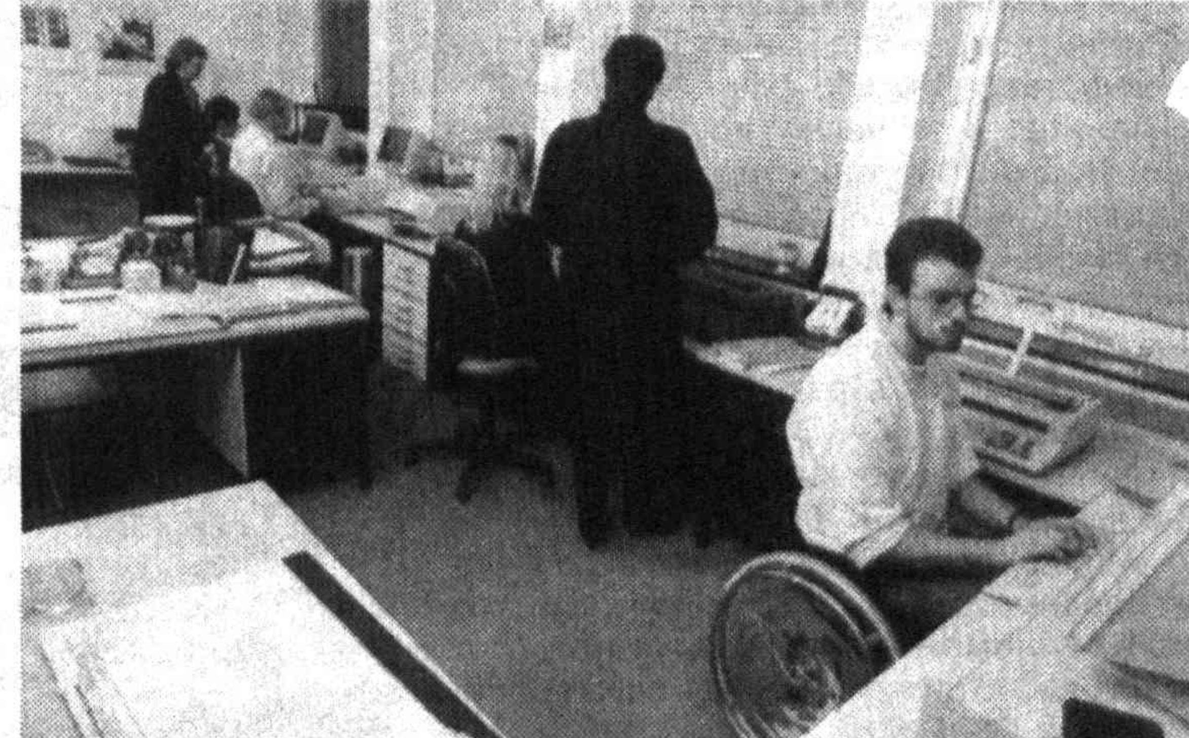
Помощь инвалидам в приобретении профессии.

Каждая из трех компаний ННО будет направлена на конкретные перемены в политике или практике правительства.