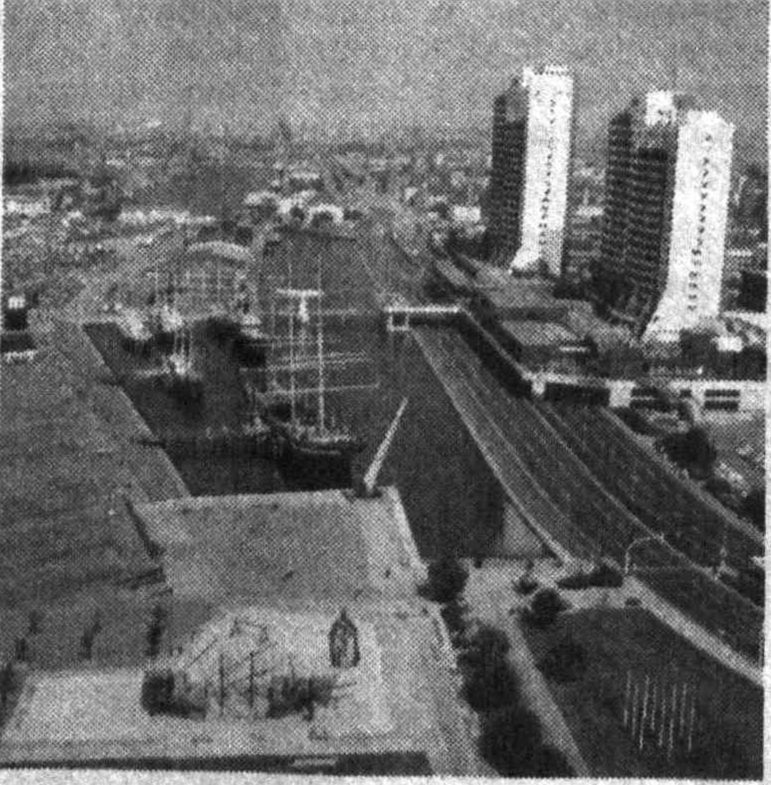
Музей судоходства и набережная Колумба в Бремерхафене