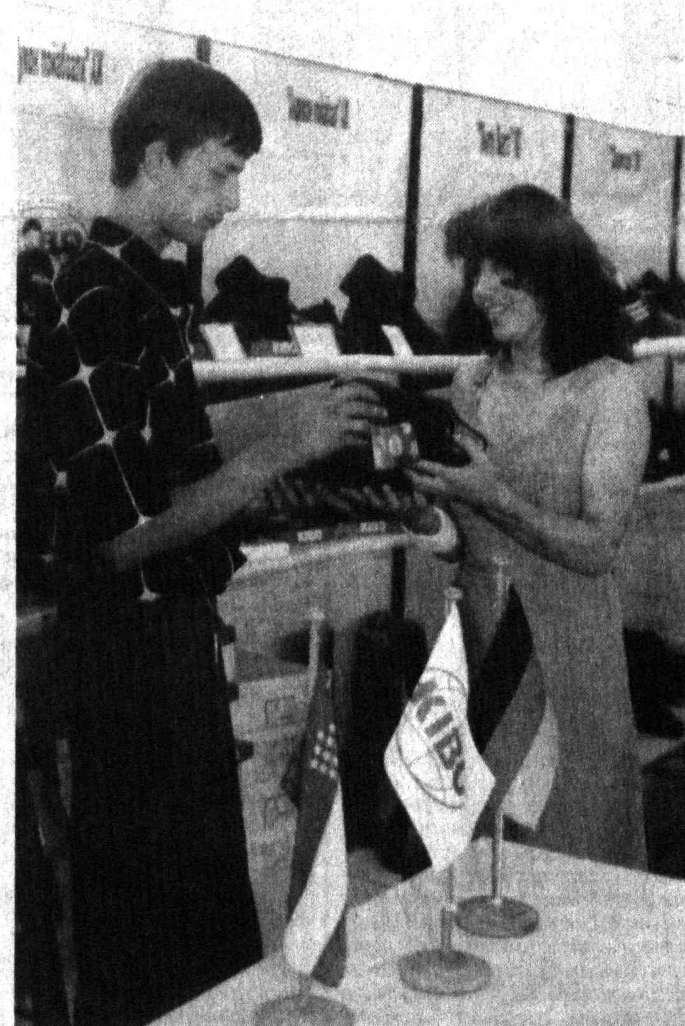
На снимках: оргкомитет выставки - работа в режиме реального времени; обуза чирчикской фирмы «Кибо»: качество и дешевизна.