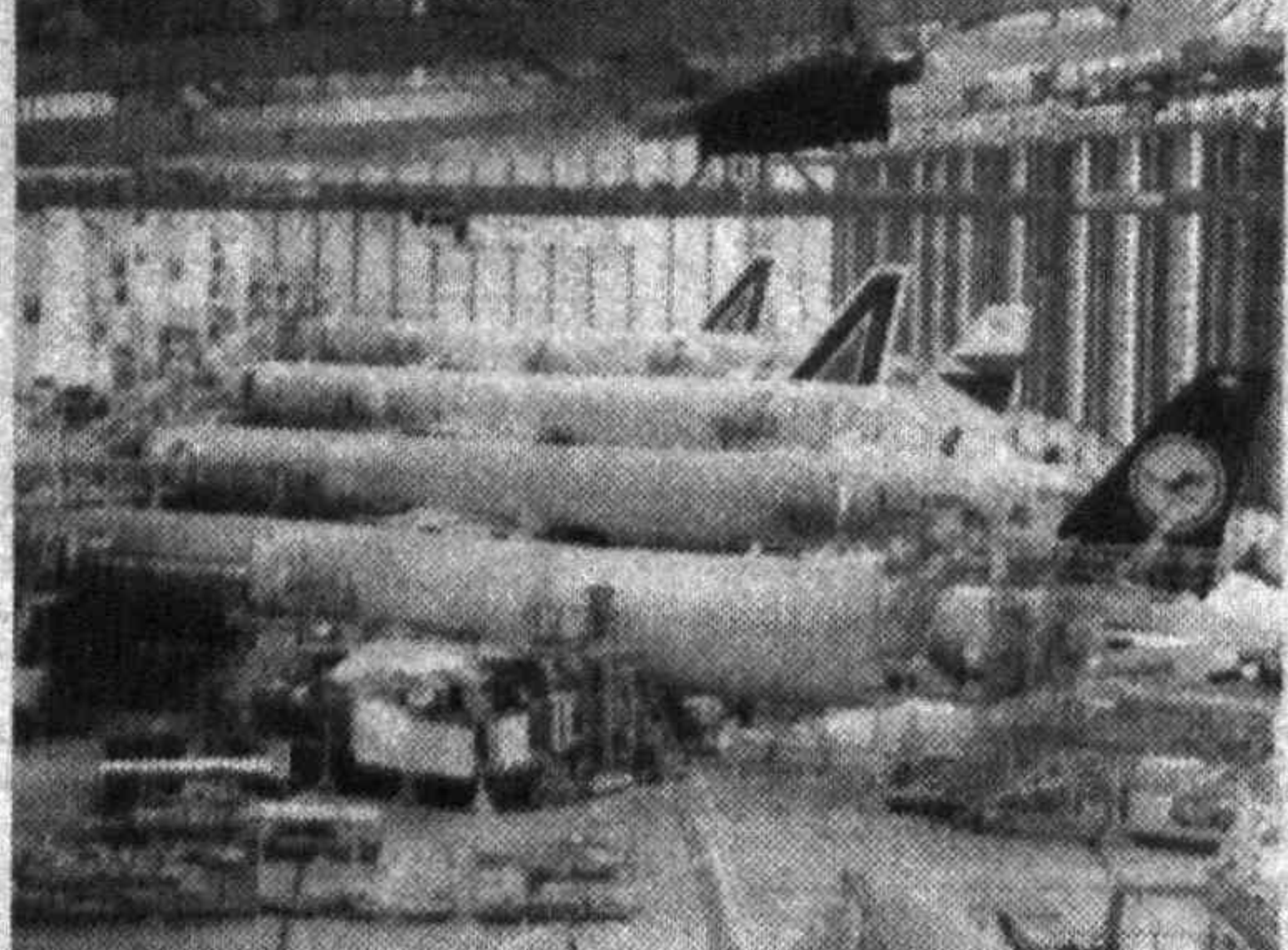
Сборка аэробуса А - 321 в Гамбурге

ция «Немецкая волна», то какое отношение к радио имеет «Музыкальное лето»?