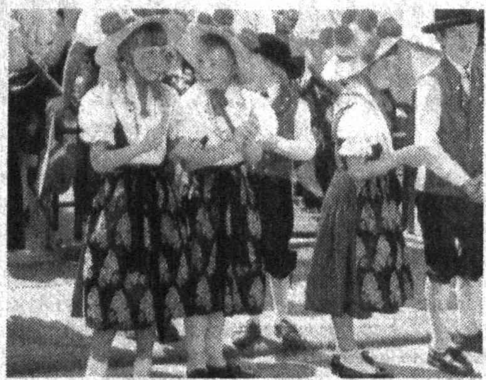
Национальный головной убор жителей Шварцвальда