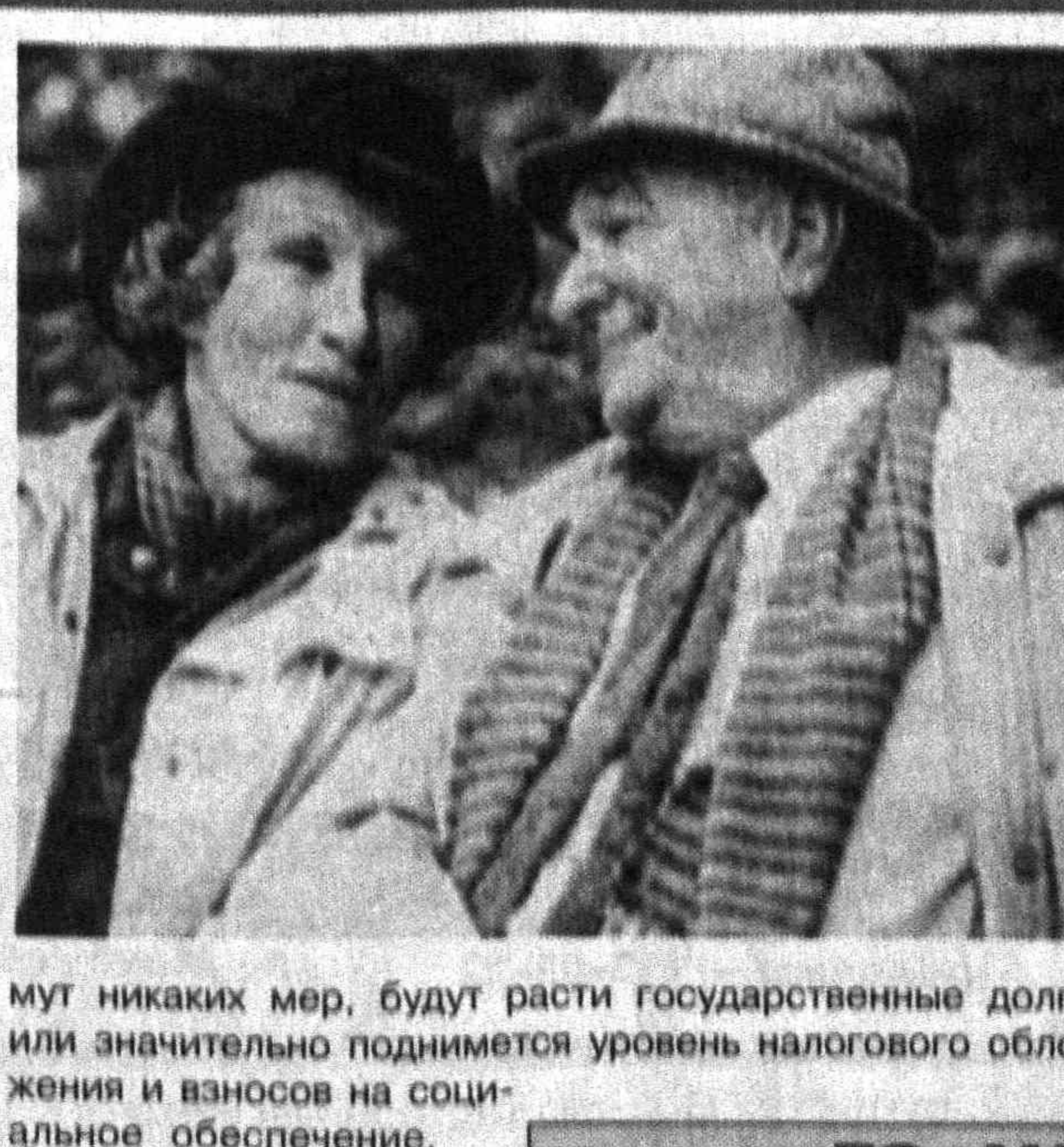
материалы средств массовой информации

Стена сооружается Министерством обороны Израиля с целью изоляции сектора Газа от еврейских поселений. Общая длина ограждений составит более 360 километров, а строительство обойдется в 200 миллионов долларов.