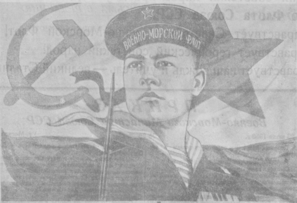
Защитникам морских рубежей Советского Союза — слава! План работы художника М. Соловьева.