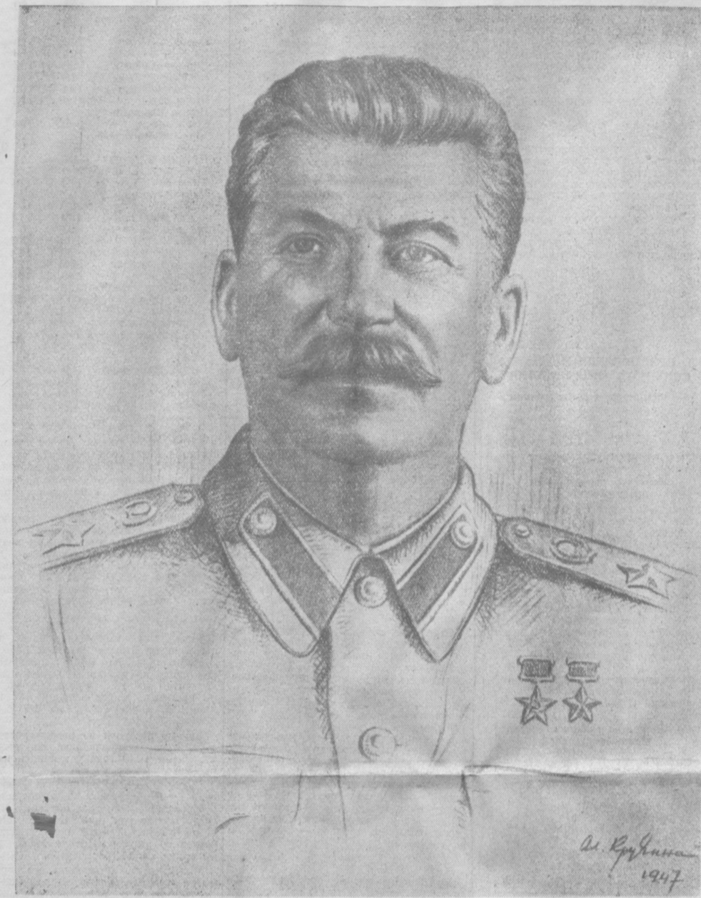
Иосиф Виссарионович СТАЛИН.