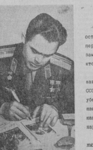
Читателям «Правды Востока»