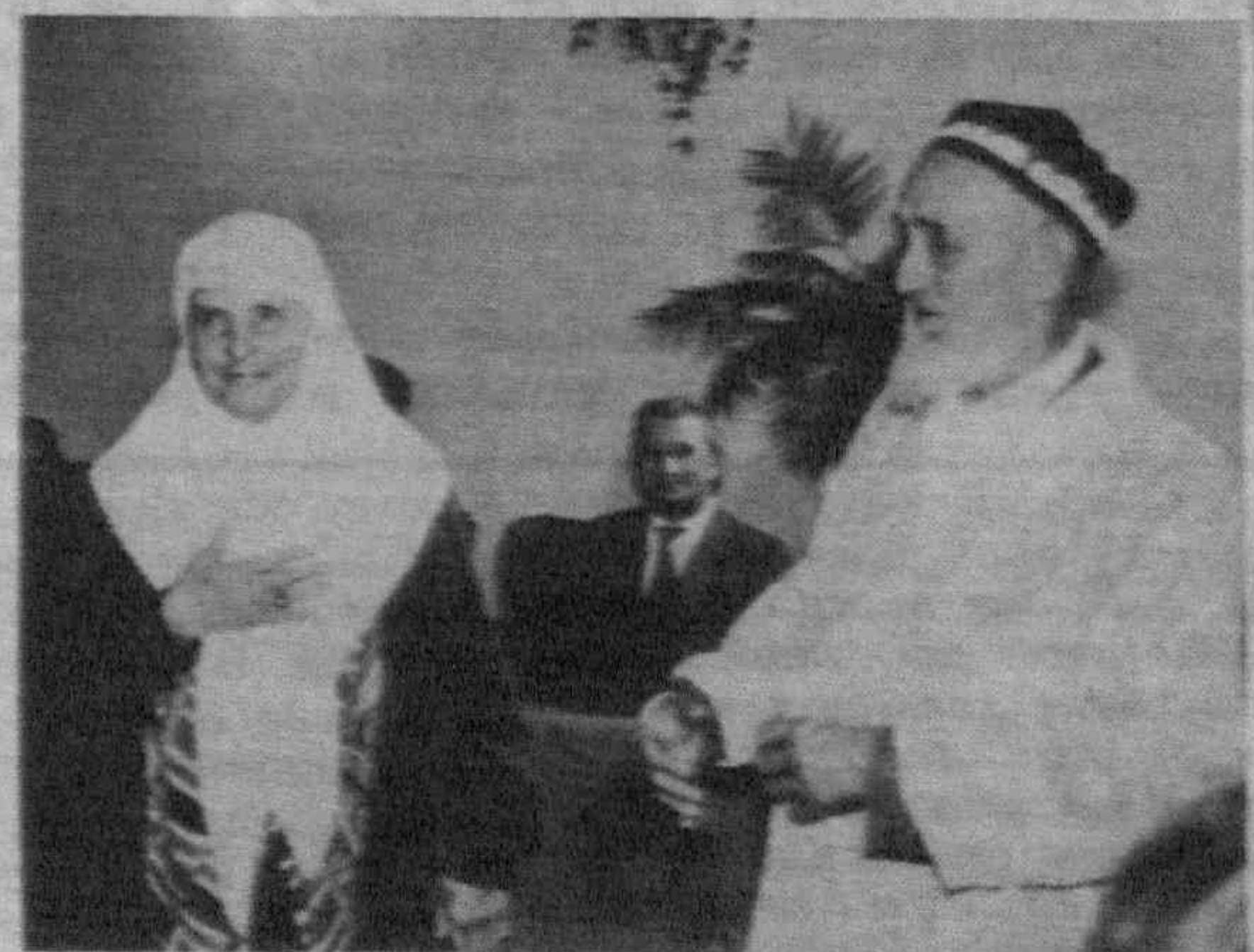
Счастливые «молодожены» очень довольны подарками, которые им поднесли в день «золотой свадьбы».

лания работниками загсов. Мы увидели много разнообразных