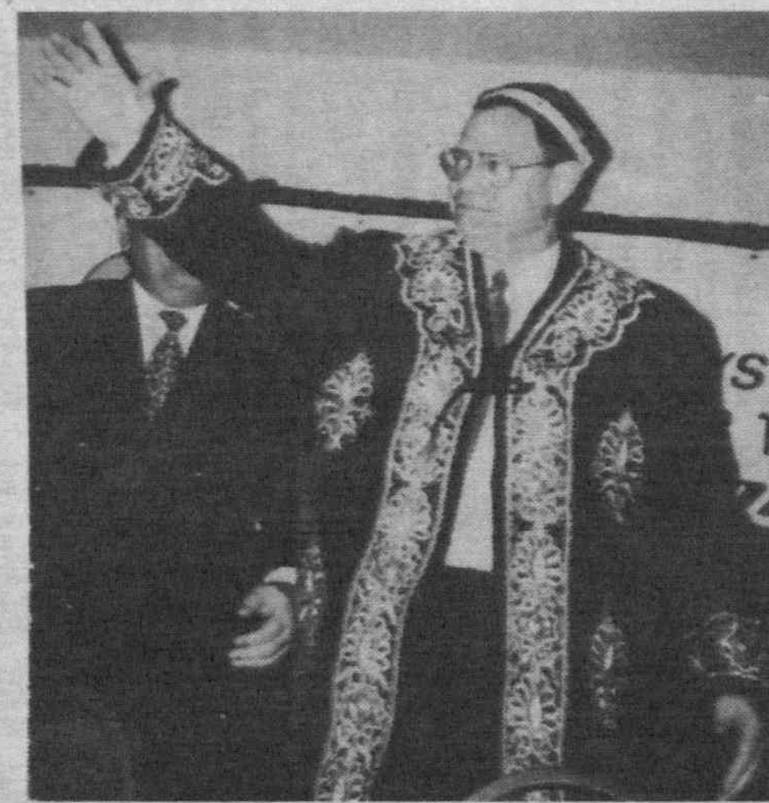
Авиастроительному «королю» Ф. Кондиту очень к лицу «ханский» халат.

Действительно, американцы умеют работать и умеют отдыхать, умеют соблюдать традиции и ритуалы. Мы убеждались в этом и в другой раз — когда как-то вечером гостеприимные хозяева повезли нашу делегацию в «ковбойский» ресторан. Мало того что на каждого из нас надели на стоящую ковбойскую шляпу (помните, из рекламных роли-