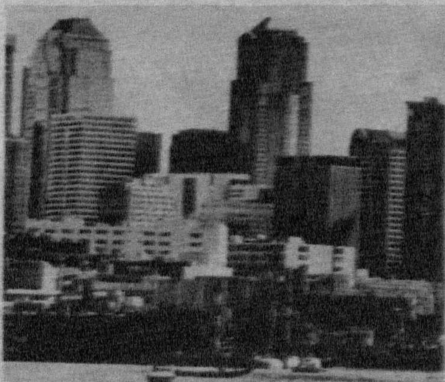
Центральный канал г. Сизтла.

«Ваш Президент И. А. Каримов — человек, безусловно, мудрый и опытный политик. У нас в Штатах поначалу к нему отношение было несколько сдержанным, но он своей активной и ясной позицией сумел «завоевать» Европу — доверие руководителей ФРГ, Франции, Великобритании, и это произвело сильное впечатление на вашингтонскую администрацию».