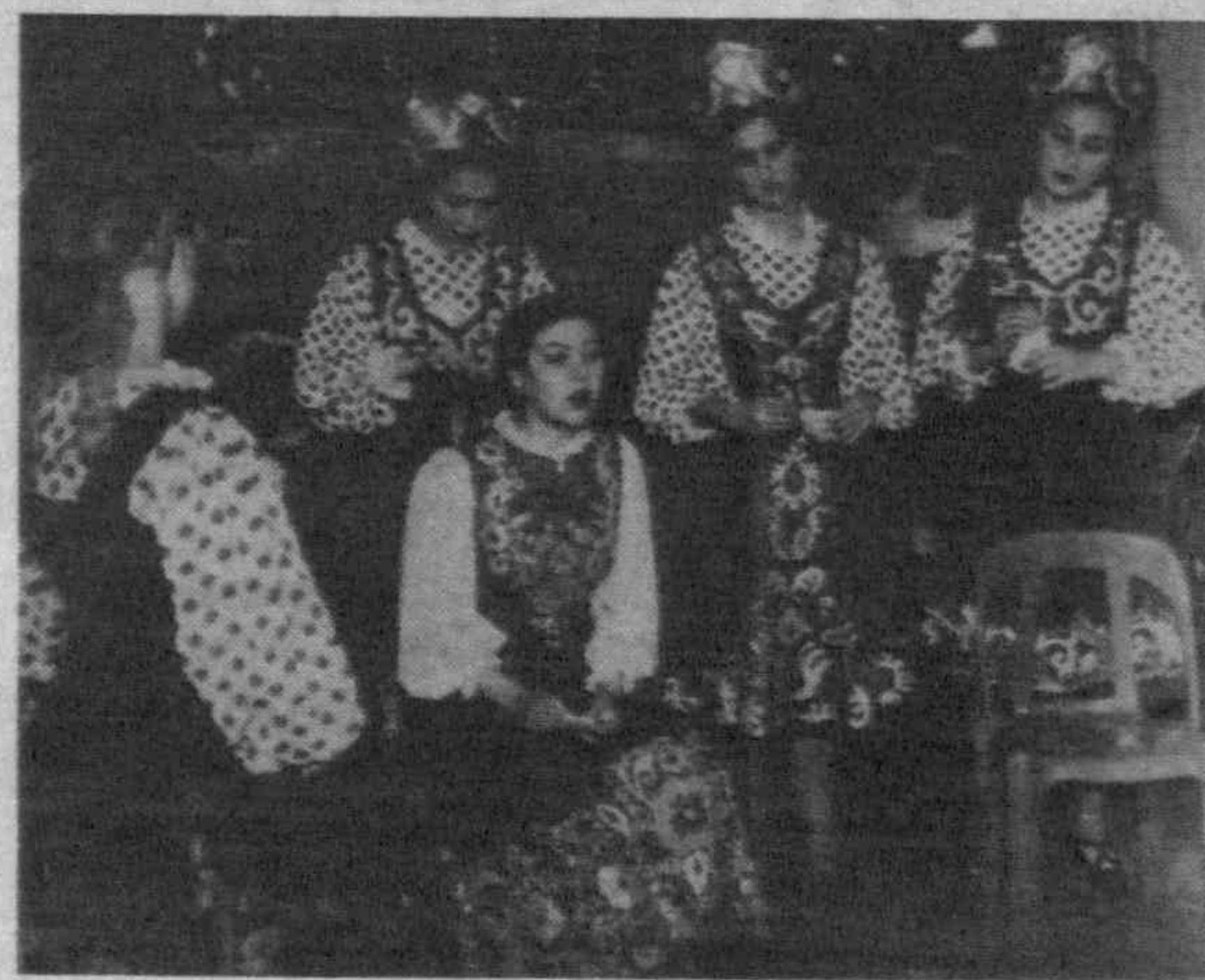
Подруги наряжают невесту и поют ей здравицу.