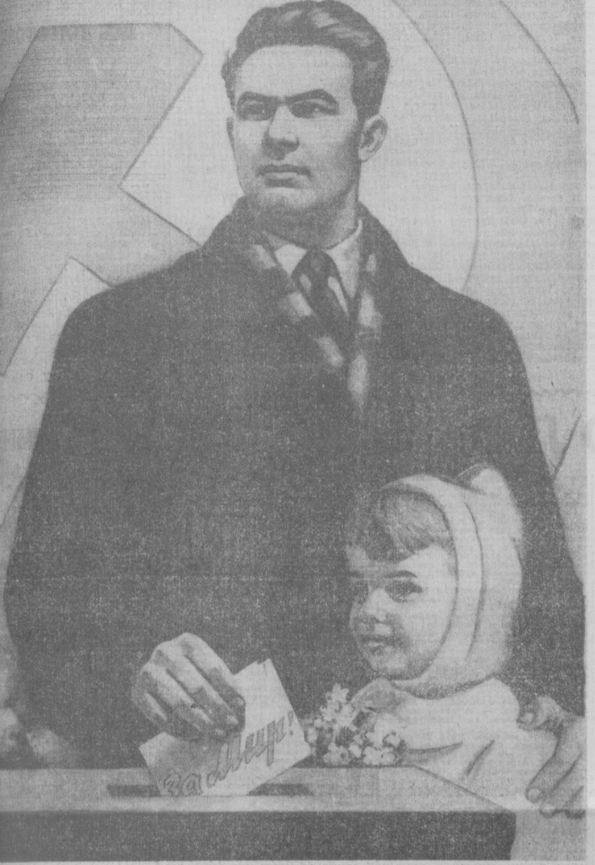
Писатель худ. А. Лаврова (Изюга).