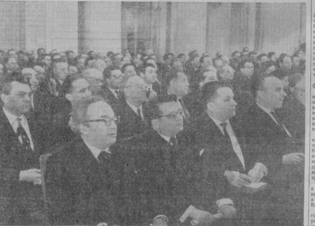
На встрече руководителей партии и правительства с деятелями литературы и искусства.

Хочется повторить, что обстановка, которая сложилась в советском искусстве и литературе, в целом здоровья. Радует то, что правдивый и заботливый народный писатель, заставил ее задуматься над важнейшими задачами художественного творчества, придал ей новые силы в борьбе за коммунизм. (Аллодисменты).