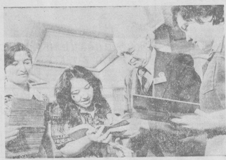
На снимке: лауреат Нобелевских премий профессор Л. Полинг (США) во время перерыва заседания симпозиума дает автограф.

Симпозиум, который проходит в Узбекистане, отметил французский ученый, даст возможность углубить