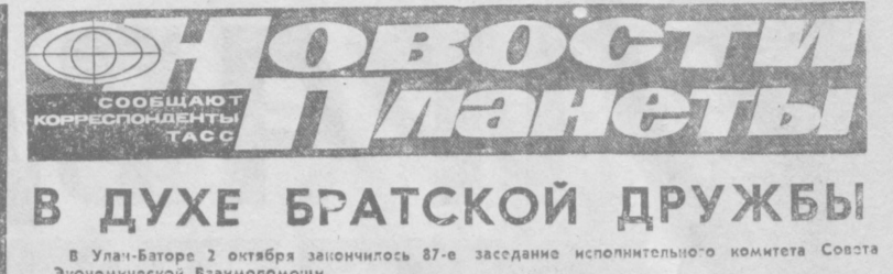
В Улаан-Баторе 2 октября закончилось 87-е заседание исполнительного комитета Совета Экономической Взаимопомощи.

В работе заседания приняли участие представители Болгарии, Венгрии, Бельгии, ГДР, Кубы, Монголии, Польши, Румынии, СССР, Нехословании, а также Югославии. Они обсудили актуальные вопросы, связанные с реализацией Комплексной программы социалистической экономической интеграции, выполненной решением XXIII заседания сессии XXIV, а также другие проблемы, представляющие взаимный интерес. Заседание прошло в атмосфере братской дружбы и взаимопонимания, в духе договоренности, достигнутой в Крыму на встречах Л. И. Брежнева с руководи-