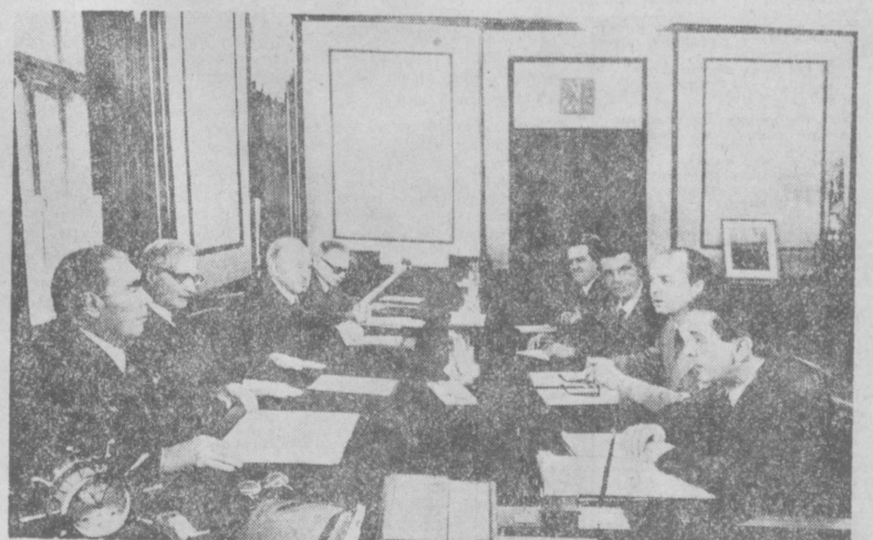
На снимке: во время беседы.

9 октября под председательством академика А. П. Александрова состоялась пленум комитета, в работе которого приняли участие виднейшие ученые и специалисты народного хозяйства страны. Пленум рассмотрел работы, участвовавшие в конкурсе на соискание Государственных премий СССР 1978 года, и итоги их общественного обсуждения.