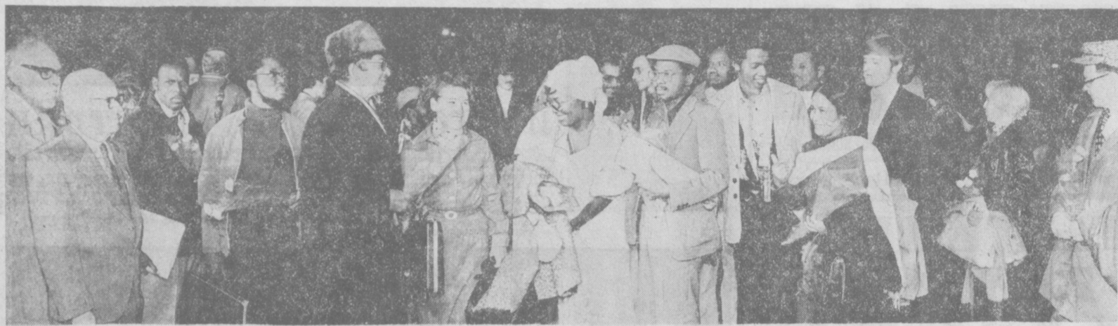
Тепло и сердечно встретила столица Узбекистана участников международной встречи писателей Азии и Африки. На снимке: встреча в Ташкентском аэропорту.