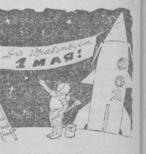
В недалеком будущем.