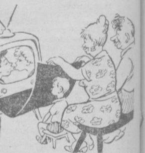
Когда «детям до шестнадцати лет».