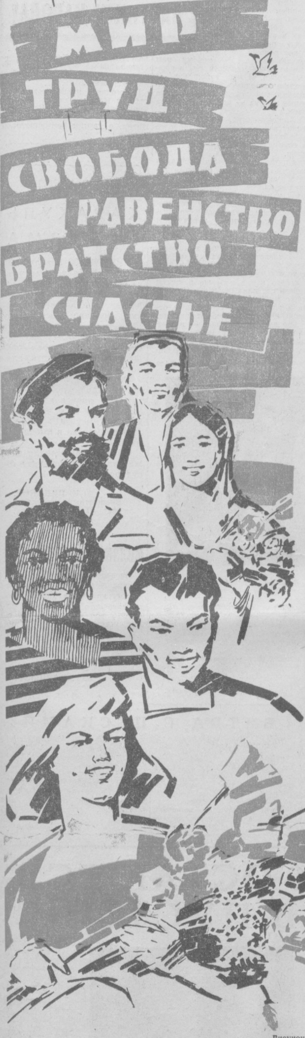
Рисунок В. Евнино.

КОЛЛЕКТИВ КАТАКУРГАНСКОЙ ТЕПЛОЭЛЕКТРОЦЕНТРАЛИ ДОСРОЧНО ЗАВЕРШИЛ ЧЕТЫРЕХМЕСЯЧНЫЙ ПЛАН. СЕБЕСТОИМОСТЬ ОДНОГО КИЛОВАТТ-ЧАСА ЭЛЕКТРОЭНЕРГИИ СНИЖЕНА ПРОТИВ ПЛАНА ПОЧТИ НА ДВА ПРОЦЕНТА.