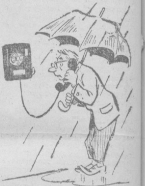
— Бюро погоды? Сегодня дождь? Не может быть!..