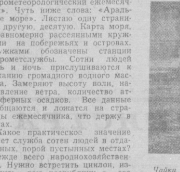
Чайки над Чимкунганским водохранилищем.

Я увидел их на Чимкунгане. Но начну с того, что я сейчас в Министерстве водного хозяйства республики листою. «Морской гидрометеорологический ежемесичник». Чуть ниже слова: «Аральское море». Листою одну страну, другую, десятую. Карта моря, с равномерно рассеянными кружками на побережьях и островах. Кружками обозначены станции гидрометслужбы. Сотни людей день и ночь прислушиваются к дыханию громадного водного массива. Замеряют высоту волн, направление ветра, количество атмосферных осадков. Все данные обобщаются и ложатся на страницы ежемесичника, что держу в руках.