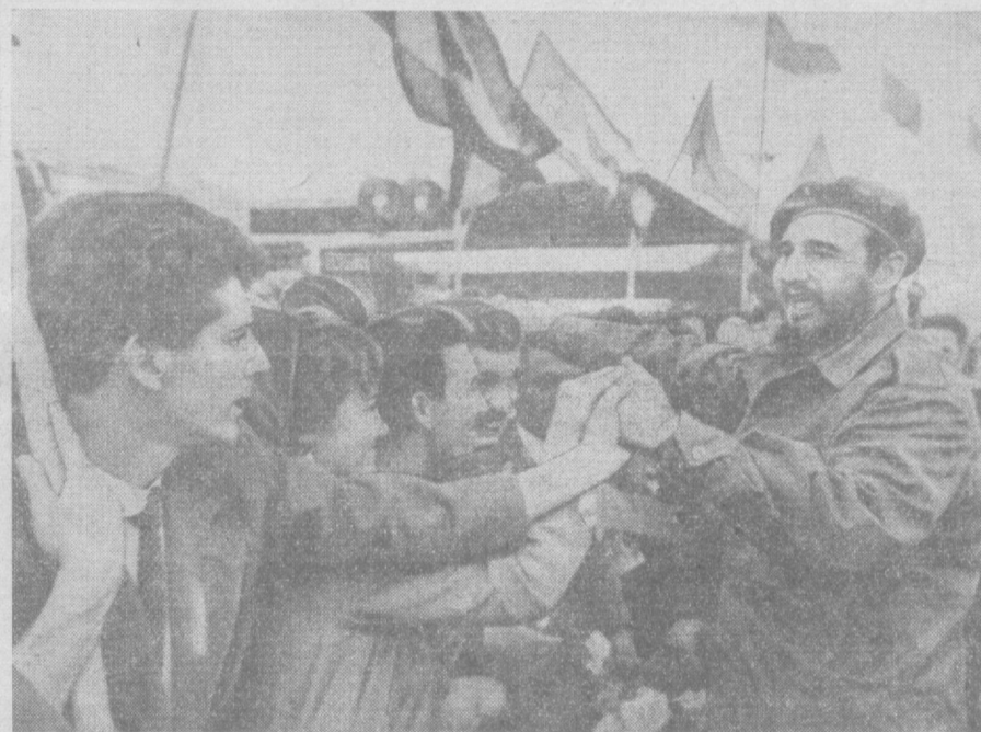
Прибытие в Узбекистан Фиделя Кастро. На снимках: встреча в Ташкентском аэропорту.