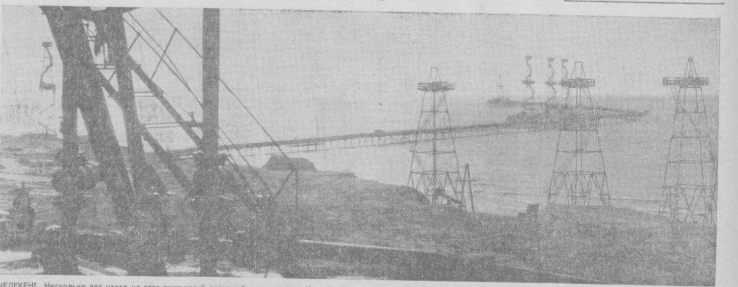
ЧЕЛЕКЕНИ. Несколько лет назад на этот пустынный песчаный полуостров в Каспийском море пришли советские люди. Железный лес вышек вырос на берегу, Морская эстакада вытянулась в море на полтора километра. Пять-морских-скважин уже дают нефть, а-разведчики-сообщают-о-новой-нефтеносной-целине.

Р. ЭСЕНОВ. (Корр. «Правды».) г. Ашхабад.