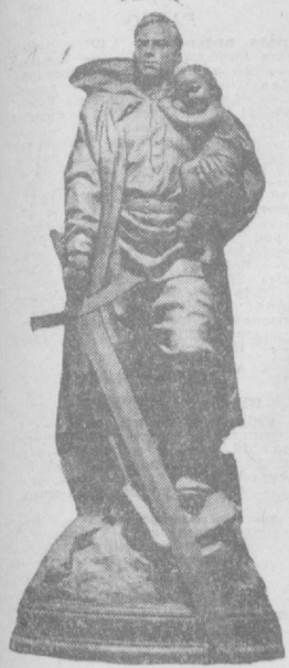
Памятник советскому воину-освободителю в Трептов-парке в Берлине. Автор — скульптор Е. В. Вучетич.