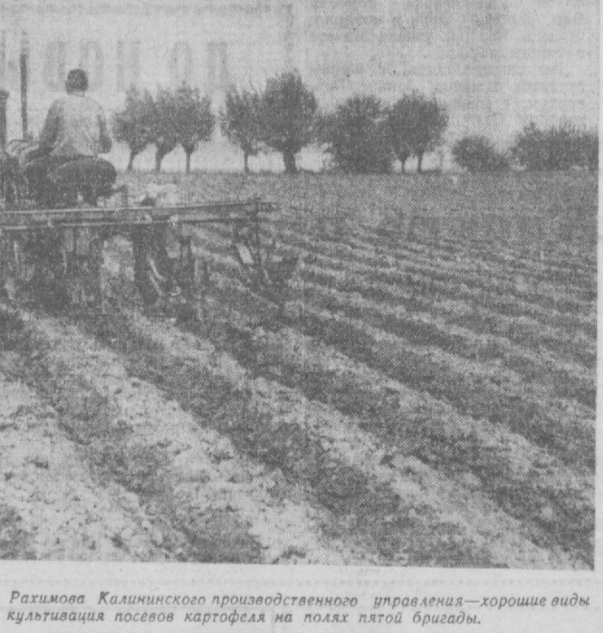
В колхозе имени генерала Сабера Рахимова Калининского производственного управления — хорошие виды на урожай картофеля. На снимке: культивация посевов картофеля на полях пятой бригады.