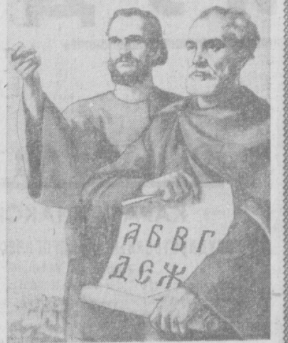
На фотоплакате: Кирилл и Мефодий — создатели славянской азбуки и письменности.

Праздник 24 мая, посвященный памяти великих просветителей IX века, то в социалистической Болгарии в этот день трудящиеся демонстрируют свои успехи во всех областях духовной жизни, достигнутые за годы народной власти. В городах и селах Болгарии проходят многолюдные манифестации, торжественные собрания представителей рабочих, крестьян, детей науки и культуры, учащихся. На них намечаются новые рубежи в борьбе за расцвет социалистической культуры, воспитания нового человека — культурного и образованного, беззаветно преданного своей социалистической родине.