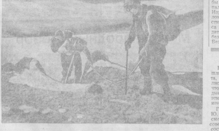
Восхождение на пик Ленина. На снимке высота 6400 м.