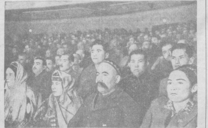
Республиканское совещание по животноводству. На снимке: в зале заседания.

доклады и лекции на различные темы. Дети встретятся со знаменитыми людьми нашей Родины, примут участие в экскурсиях по историческим местам, в музеи и на выставки. Во время зимних каникул для школьников будут бесплатно открыты стадионы, катки, лыжные базы. Республиканские, краевые и областные советы профсоюзов обязаны организовать общегородские, новгородные ёлки. (ТАСС).