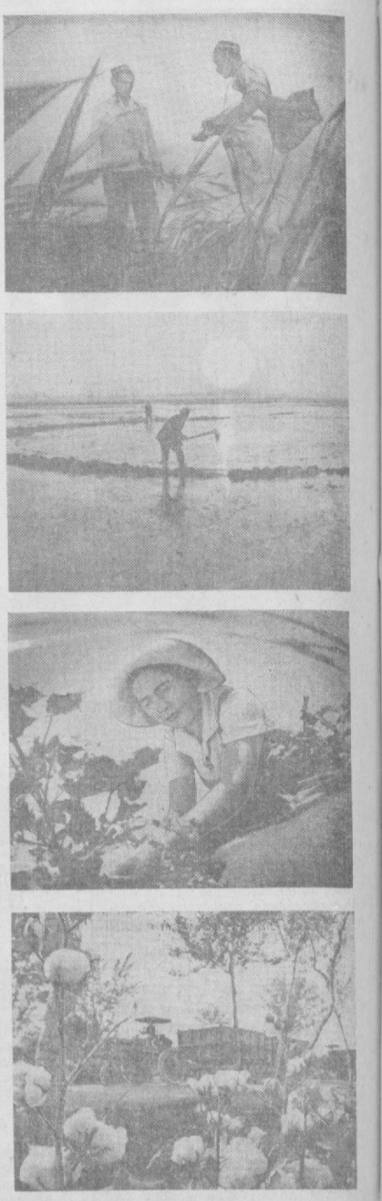
Кадры из фильма.