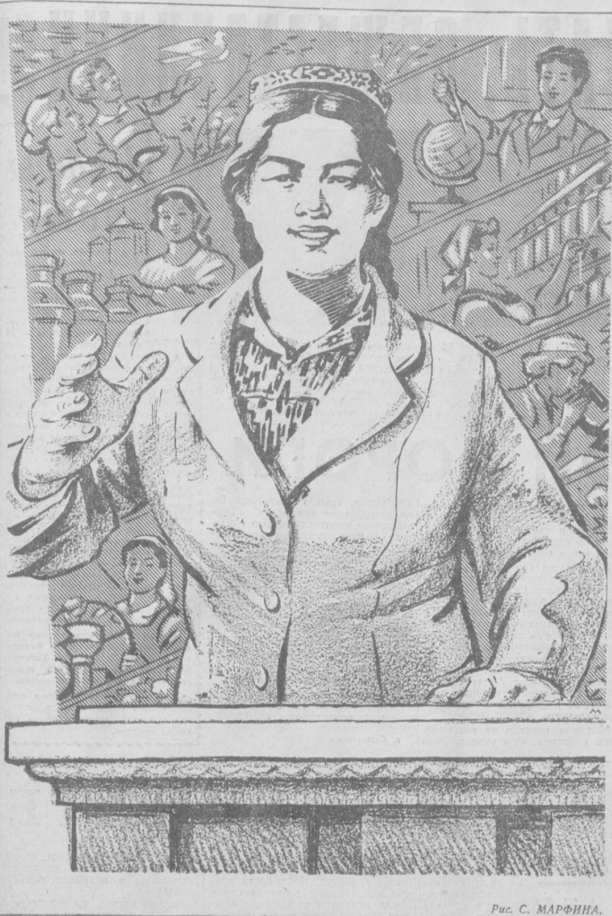
Рис. С. МАРФИНА.

Одобрена инициатива уртинбинских хлопкоборцов Таджикской ССР, принявших обязательство перевыполнить в значительных размерах государственный план хлебозаготовок. Партийным организациям предложено развернуть соревнования между колхозами, совхозами и производственными управлениями за досрочное выполнение и перевыполнение государственного плана заготовок зерна.